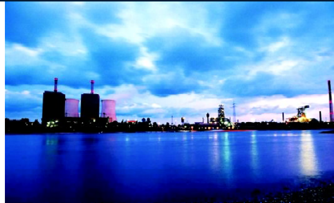
Vermittler zwischen industriellen Großkunden und Lieferanten

Daher ist eine konzeptionelle Überarbeitung des seit März 2004 etablierten zentralen „Quality-Process-Systems“ (QPS) unter Berücksichtigung aller spezifischen Anforderungen ein Schwerpunktthema im Prozessmanagement der neu gegründeten RWE Key Account GmbH.